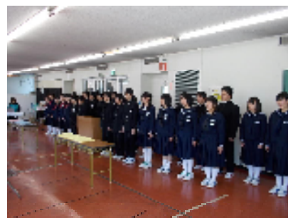
卒業式の練習(式歌)のようす

明日の卒業式は、三春交流館「まほら」で午前10時から行われます。この日を迎えるため、職員、生徒ともに精一杯準備や練習に取り組んできました。立派な会場で思い出に残る感動的な卒業式にしたいと思います。