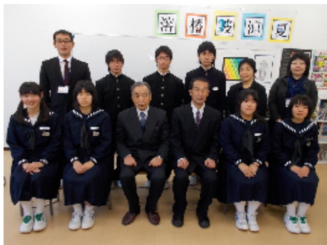
同窓会入会式で同窓会長様を囲んで記念写真

卒業式の後には、1・2年生もそれぞれ上の学年に進級します。卒業生が築いた伝統を受け継ぎ、よりすばらしい三春校となるよう、自覚と目標を持って新年度を迎えてほしいと思ひます